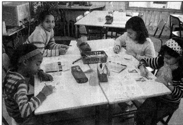
Priscilla, Camilia, Naathalie et Valérie en plein travail sur les petits livres

«On arrive à environ 50 livres par an, explique Nicolas Vallot,